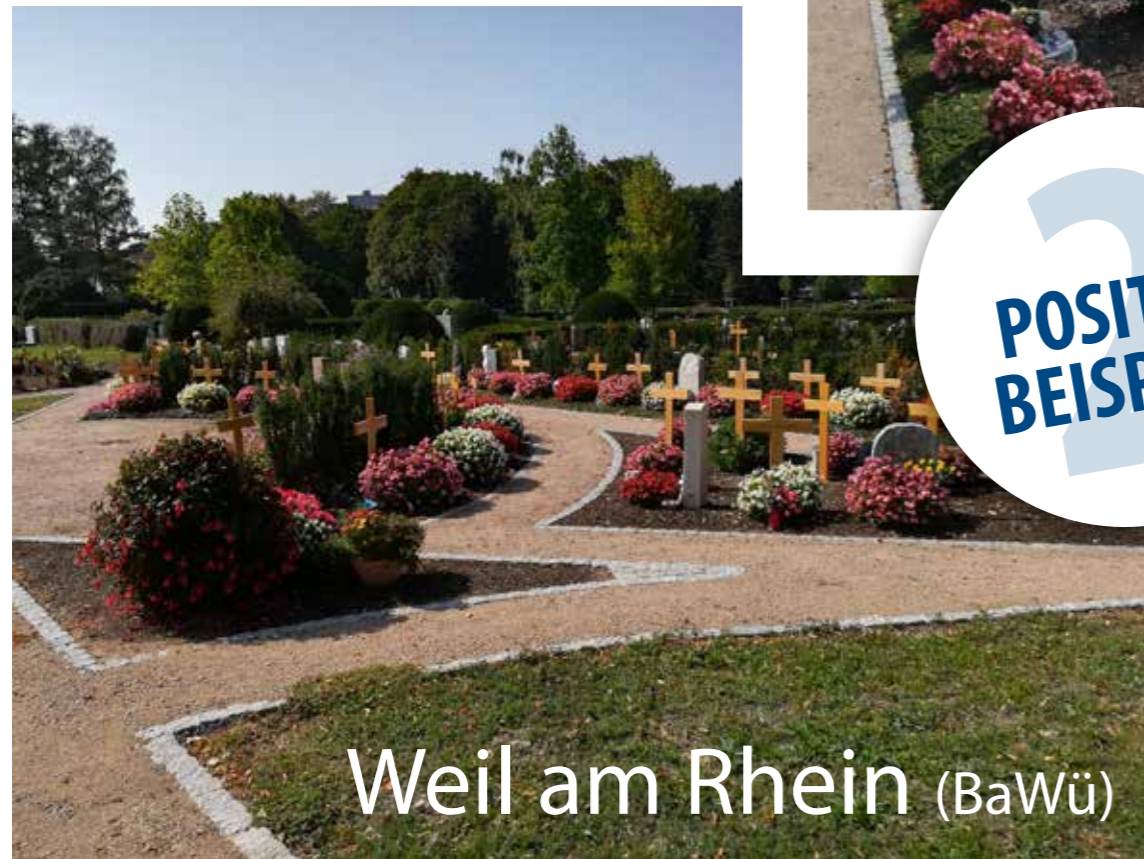
Weil am Rhein (BaWü)

Hier sehen Sie ein schön angelegtes Urnengrabfeld. Jeder verstorbene hat seinen eigenen Raum, seinen Gedenkstein. Durch Dauerbepflanzung ist keine Grabpflege notwendig, kann aber, wenn gewünscht, stattfinden. Im Gegensatz zu Bestattungswäldern und Kolumbarien sind am Fried-